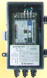
发信式自动切换调压器专用 继电器系统(RS-1)

当LAX20B-R及C-R安装在钢瓶库等危险地区时,请首先将上述本安防爆式继电器装置安装在非危险地区,然后通过此装置与该自动切换器连接。