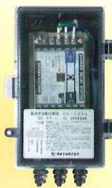
发信式自动切换调压器专用继电器系统(RS-1)

当LAX20B-R及C-R安装在钢瓶库等危险地区时,请首先将上述本安防爆式继电器装置安装在非危险地区,然后通过此装置与该自动切换器连接。